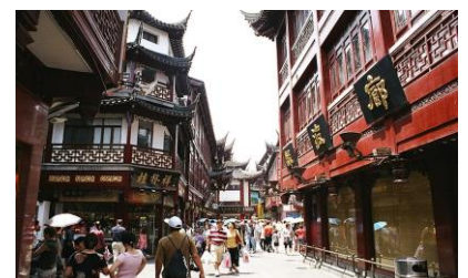
上海の下町・豫園商場