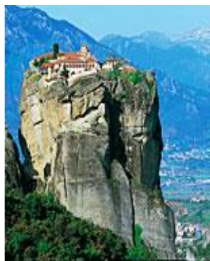
【世界遺産】メガロ・メテオロン修道院