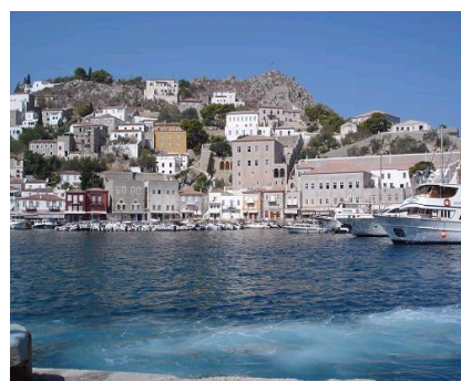
エーゲ海クルーズで寄港する「イドラ島」