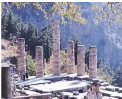
【世界遺産】デルフィの聖域