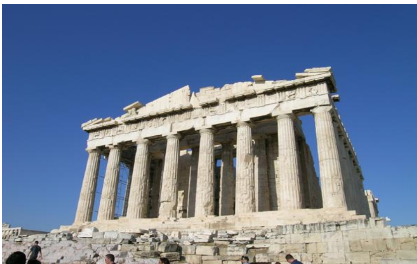
【世界遺産】アクロポリスの丘(パルテノン神殿)