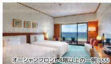
オーシャンフロント4階以上の一例($55)