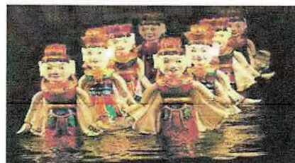
人気の水上人形劇