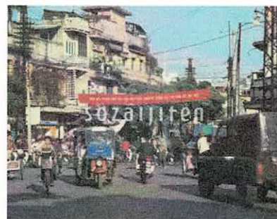
ハノイの旧市街「36通り」